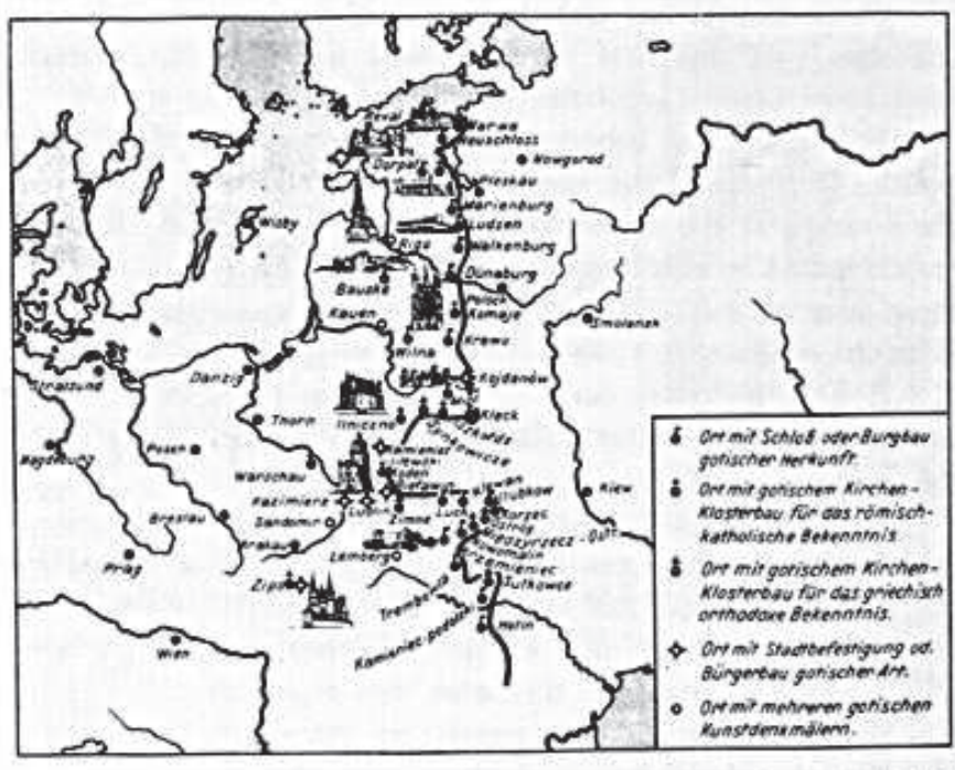
Mapa 1: Wschodnia granica występowania architektury gotyckiej. (Źródło: http://www.lituanus.org/1964/64_2_03_Reklaitis.html ).

Na początek historyczne wpływy zachodnie na Rusi zaobserwować można w architekturze. Influencję taką prześledzić można w występowaniu gotyku w terenie. Zabytki takie nie występują na wschód od linii biegnącej od Zatoki Fińskiej przez Jezioro Pejpus, rejon Dźwińska, Wileńszczyznę, głęboko wygiętym łukiem omijającej bagna Polesia, następnie biegnącej przez Ruś Halicką i dalej przez Mołdawię. Przebieg granicy występowania gotyku jest więc południkowy bez większych odchyżeń, z wyłączeniem Polesia. Kolejną granicą architektoniczną jest występowanie zabytków europejskiego baroku. Granica ta jest bliska wschodnim rubieżom dawnej Rzeczypospolitej. Przebiega wschodnim skrajem krajów bałtyckich, dalej przez Smoleńszczyznę, Mohylewszczyznę, prawobrzeżną Ukrainę, by następnie skręcić na zachód.