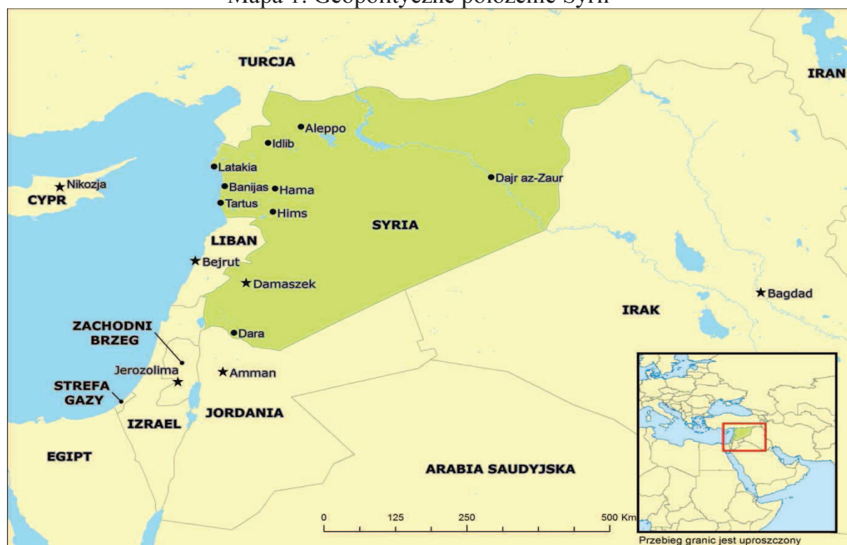
Mapa 1. Geopolityczne położenie Syrii

Protesty i demonstracje antyrządowe przerodziły się w ostry konflikt, zbrojną rebelię i w końcu w wojnę domową. Pomimo panującej w Syrii przemocy i dużej ilości ofiar (ponad 40000), reżim Asada nadal posiada poparcie nie tylko alawitów (sekta wyznaniowa), którzy stanowią mniejszość, bo ok. 10% ludności Syrii oraz chrześcijan i druzów, ale także dobrze uzbrojonej armii i Partii Baas. Syria ma również znaczne wsparcie z Iranu i Hezbollahu w Libanie, jak też posiada polityczne poparcie Rosji, która jest głównym dostawcą uzbrojenia dla armii syryjskiej, oraz Chin. Tymczasem opozycja składa się odmiennych i zróżnicowanych ilościowo grup, w większości reprezentujących sunnitów – ok. 70% społeczeństwa Syrii. Taka sytuacja jest korzystna dla Damaszku. Dlatego reżim znajduje się w dogodnej sytuacji do prowadzenia walk oraz utrzymania władzy, bez względu na to, jak duże zniszczenie powoduje to wśród ludności cywilnej. Konflikt przybrał obecnie kształt religijnej wojny domowej, z okrutnymi aktami przemocy ze strony reżimu.