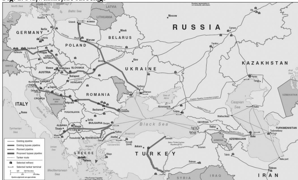
Fig. 2. Najważniejsze rurociągi