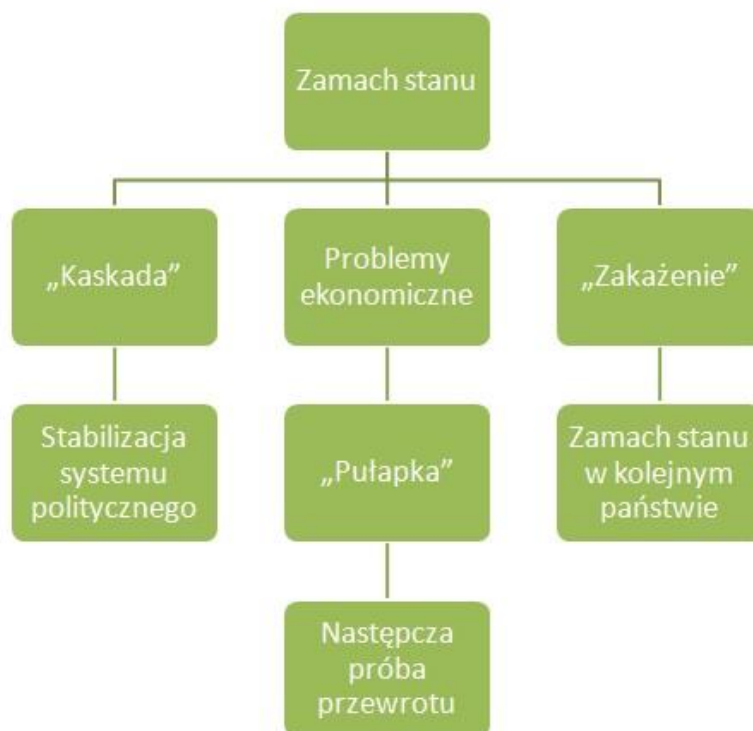
Rys. 1. Cykl zależności następstw zamachu stanu