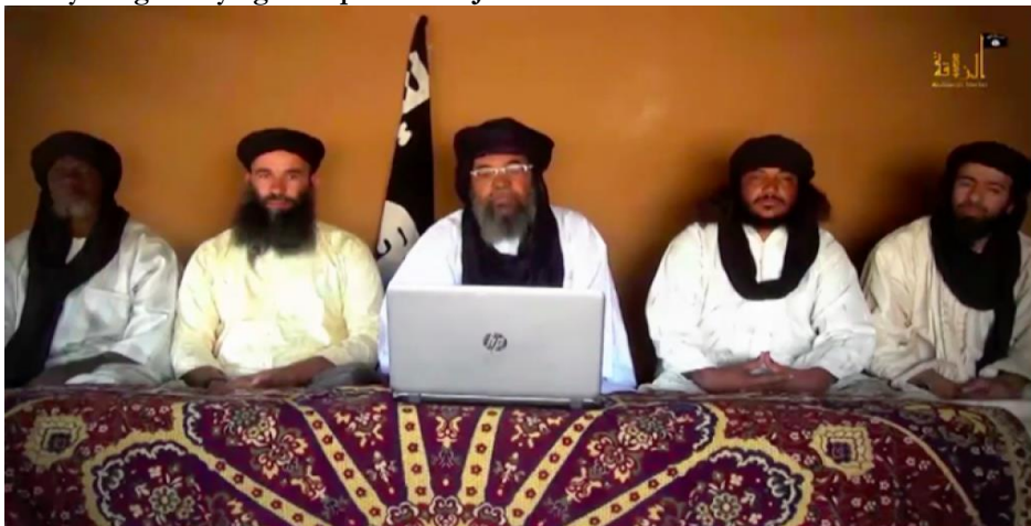
Fot. 1. Iyad ag Ghaly ogłasza powstanie JNIM w 2017 r.

Wadoudowi (Abdulmalek Droukdel), Aymanowi al-Zawahiriemu oraz emirowi talibów w Afganistanie – Mullahowi Haibatullahowi Akhundzadowi (fot. 1). Grupami, które weszły w skład JNIM, były: Ansar Dine, Al-Murabitoon, komórka AQIM działająca na Saharze oraz Macina Liberation Front (MLF), znana także jako Katibat Macina . W trakcie swojego oświadczenia z 2 marca 2017 r. Ghaly stwierdził, że organizacje te zostały zjednoczone, aby pod jednym emirem wystąpić przeciwko „krzyżowcom” – miał tu na myśli głównie Francję.