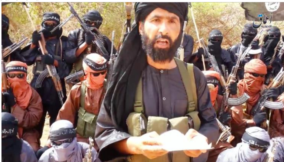
Fot. 5. Abu Walid al-Sahrawi składający oświadczenie wierności tzw. Państwu Islamskiemu

później jednak zmienił zdanie. Kiedy w kwietniu 2014 r. Al-Masri został zabity, Al-Tilemsi został wyznaczony na emira, jednak sam szybko został zabity przez siły francuskie na północy Mali w grudniu 2014 r. Nowym liderem został Al-Sahrawi, co nie zostało zaakceptowane przez Belmokhtara. W konsekwencji doszło do rozłamu w ramach organizacji i zbliżenia Sahrawiego do IS (Lebovich, op.cit.).