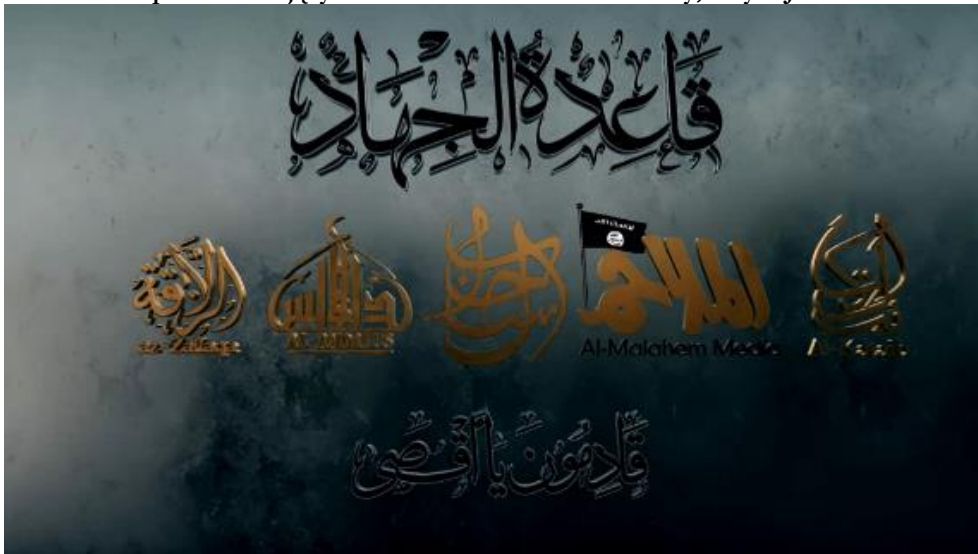
Fot. 5. Obraz przedstawiający różne media odłamów Al-Kaidy, w tym JNIM