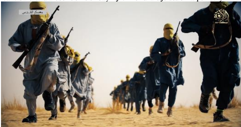
Fot. 2. Ćwiczenia w obozie szkoleniowym JNIM o nazwie Jerasalem w północnym Mali

W marcu 2018 r. JNIM opublikował materiał propagandowy, zaczynający się od wypowiedzi Aymana al-Zawahiriego, któremu JNIM przysiągł lojalność, zachęcającego do atakowania celów związanych z Francją i jej sojusznikami. Następnie na filmie widać aktywność JNIM oraz dwa obozy szkoleniowe (fot. 2). W szczególności sfilmowano atak na pozycje armii malijskiej koło Soumpi w rejonie Timbuktu, z 27 stycznia 2018 r., kiedy śmierć poniosło 14 żołnierzy malijskich i 4 JNIM. Na filmie widać, jak członkowie JNIM wynoszą z bazy duże ilości broni i amunicji. Część zdjęć nagrano z komercyjnego drona. Według „FDD’s Long War Journal” od początku 2018 r. do marca przeprowadzono 53 ataki w Mali i Burkina Faso związane z Al-Kaidą. W całym 2017 r. było to co najmniej 276 ataków.