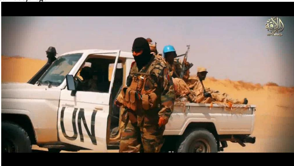
Fot. 3. Pojazd JNIM pomalowany na wzór ONZ przygotowywany do ataku samobójczego