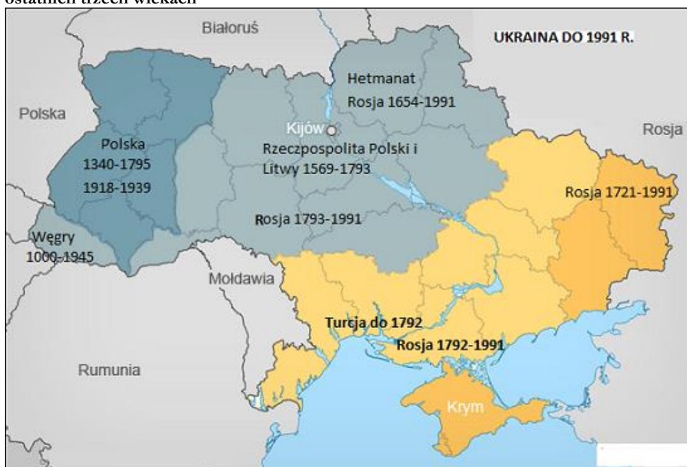
Ryc. 1: Historyczna przynależność państwowa poszczególnych obszarów Ukrainy w ostatnich trzech wiekach