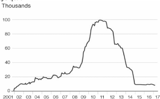
Ryc. 3. Liczebność wojsk amerykańskich w Afganistanie, w latach 2001-2017, w tysiącach

zagrozało niebezpieczeństwo ze strony talibów, niejednokrotnie znajdujących poparcie u ludności miejscowej. Dzięki temu poparciu talibowie mogli przez lata ukrywać się, organizując akcje zbrojne przeciwko oddziałom rządowym w trudno dostępnym, górskim terenie. Amerykanie nie byli w stanie wykryć i zniszczyć wszystkich kryjówek terrorystów, co w konsekwencji doprowadziło do tego że musieli, oni uznać wyższość talibów, którzy w końcowym okresie wojny byli zdolni do zdobycia Kabulu i wszystkich pozostałych miast.